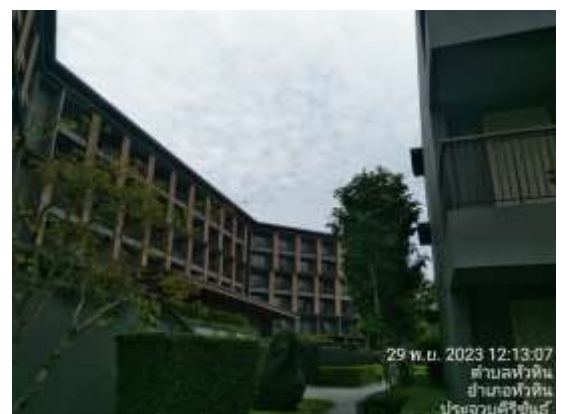
ภาพที่ 1.2-2 – สภาพโครงการปัจจุบัน